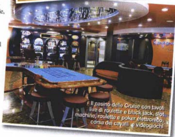
Il casinò delle Cruise con tavoli live di roulette e black jack, slot machine, roulette e poker elettronico, corsa dei cavalli e videogiochi