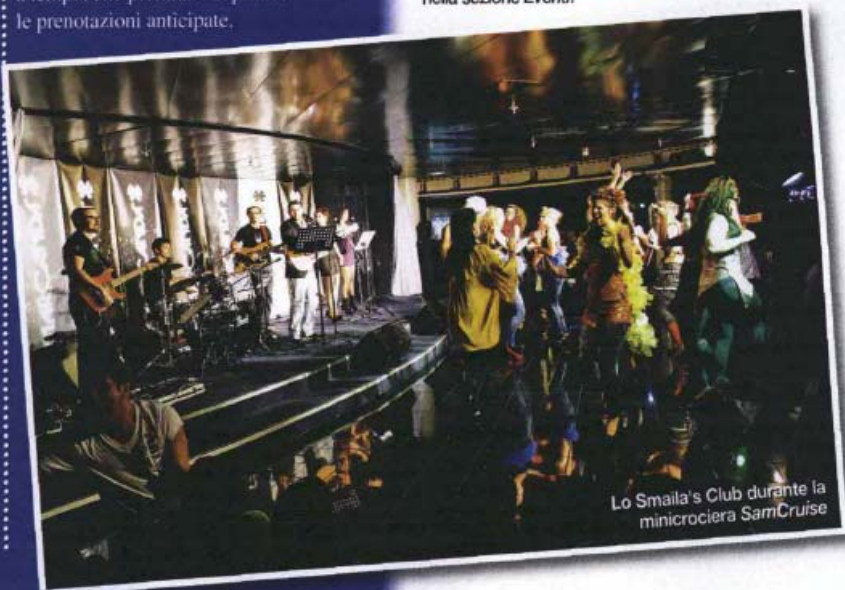
Lo Smilla's Club durante la minicrociera SamCruise