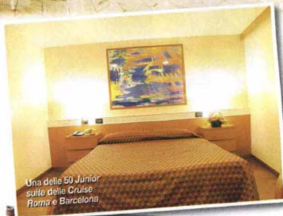
Una delle 50 Junior suite delle Cruise Roma e Barcelona

Insomma, è veritiero affermare che ci sentiamo tutti sulla stessa barca, come una grande famiglia."