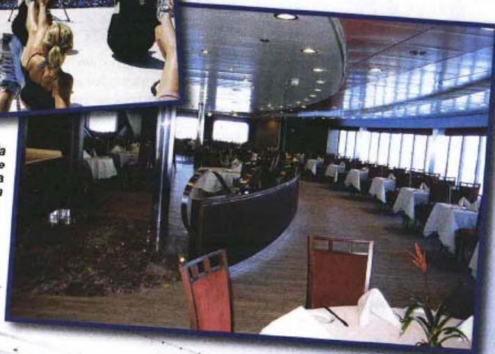
Il ristorante à la carte della Cruise Roma e della Cruise Barcelona